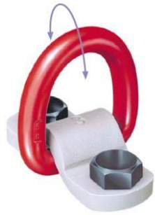
Tabelle 1 TAPG